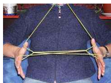
Das Boot auf dem See