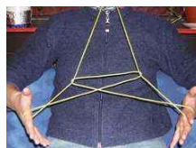
Der Leuchtturm am Strand