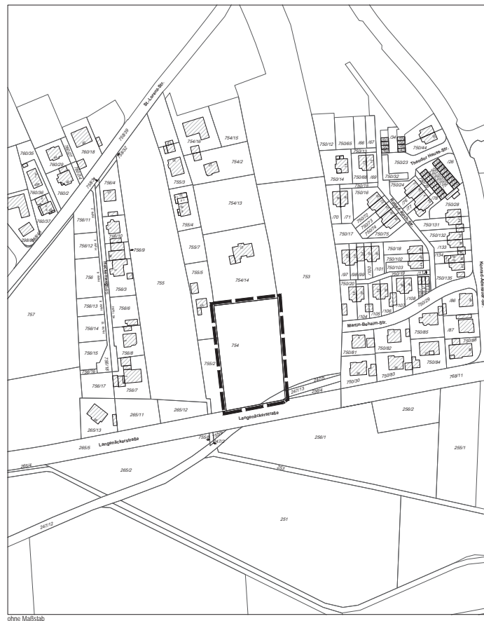
Geltungsbereich des Bebauungs- und Grünordnungsplan Nr.19/2 "An der Langenackerstraße"